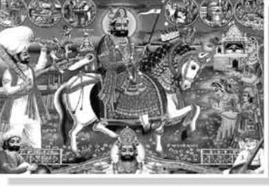
॥ જય રામાપીર ॥

* શુભ સ્થળ * રામલીલા મેદાન, ગૌશાળા લેન મલાડ (ઈસ્ટ)