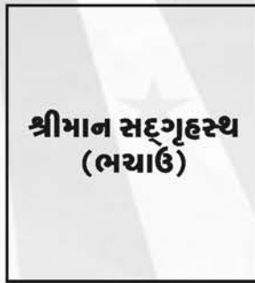
શ્રીમાન સદ્ગૃહસ્થ (ભચાઉ)

વાગડના ગૌરવવંતા યુવક-યુવતીઓ સંગઠનની ખુમારી સાથે 'યુવા-હૃદય'ના સ્પંદનો ઝીલશે એક બીજાના હાથ સાથે હાથ મેળવી ભાઈચારાનો નાદ જગવશે હસતા-સ્મતા-ગાતા ઝૂમતા 'યુવાશક્તિનો ટંકારવ ગજવશે