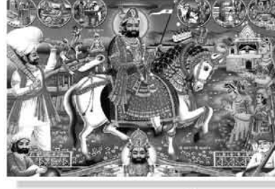
॥ જય રામાપીર ॥

* શુભ દિવસ * તા. ૧૯.૦૨.૨૦૧૭ રવિવાર સાંજે ૫ થી ૧૧ કલાકે